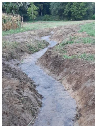
Le reméandrage du lit

Quelques exemples de solutions techniques en photo :