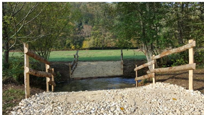
Un passage à gué