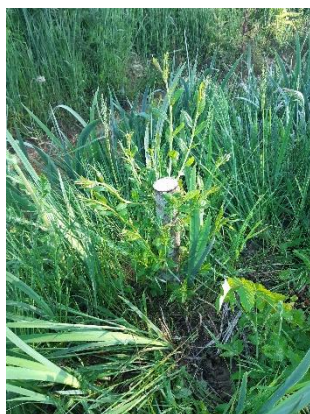
Une restauration de ripisylve