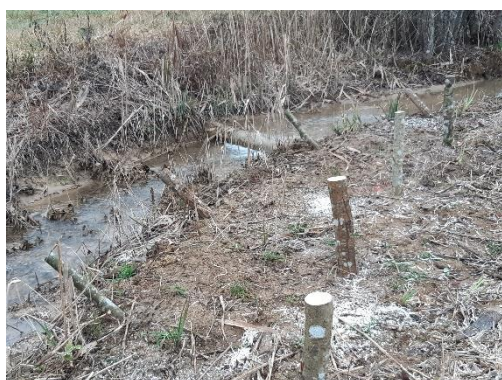
Jour de Plantation